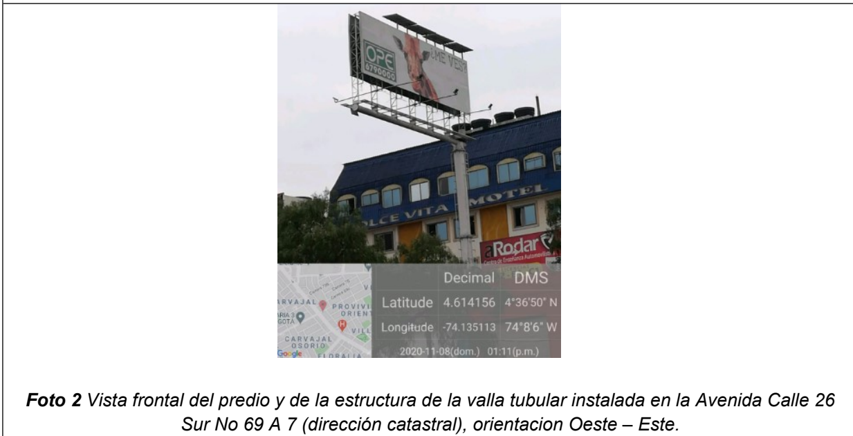
Foto 2 Vista frontal del predio y de la estructura de la valla tubular instalada en la Avenida Calle 26 Sur No 69 A 7 (dirección catastral), orientación Oeste – Este.